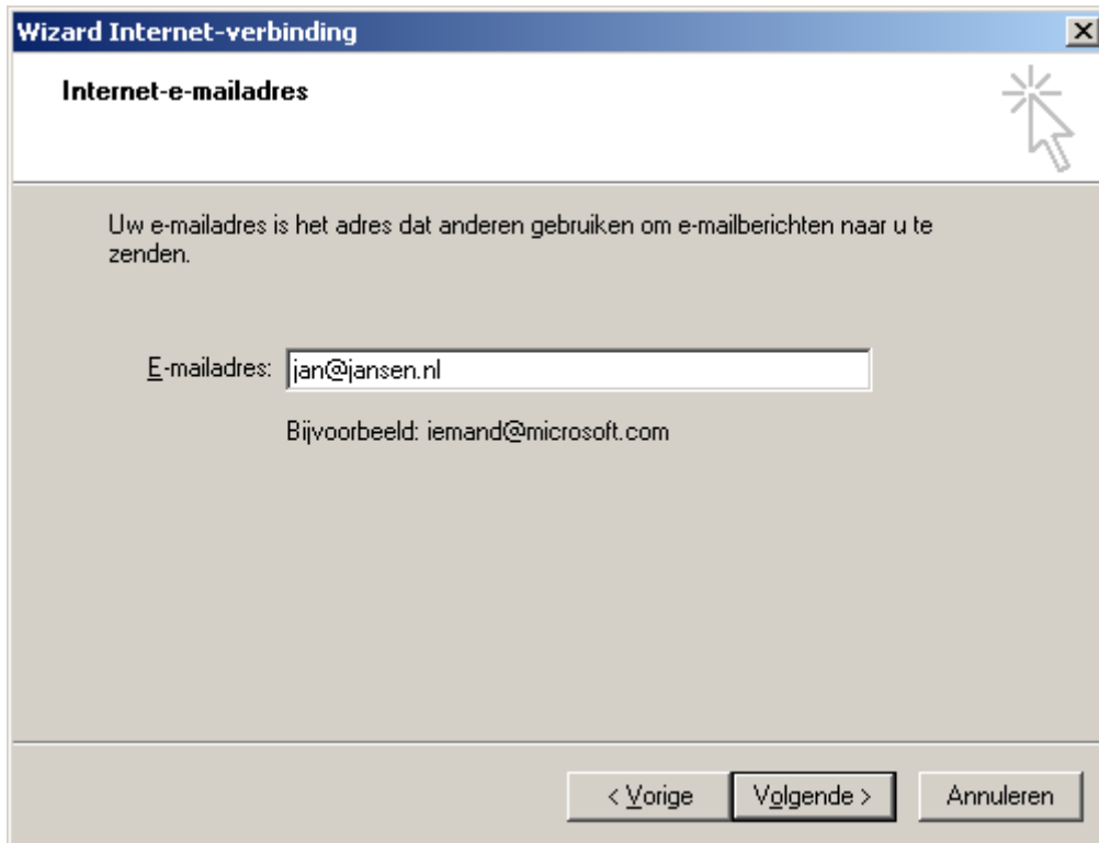
figuur 3: invoeren e-mailadres

U kunt hier het e-mail adres invullen waarvoor dit account bedoelt is. En druk op Next of Volgende .